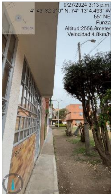
Ilustración 4. Distancia árbol-casa

C.P.250020 Tel. +57(1) 823 40 70 823 40 71 / 823 40 73 Fax. +57(1) 823 76 20 Dir. Cra. 14 No. 13-05