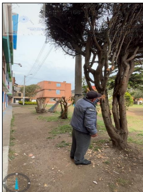
Ilustración 2. Visita técnica – Villa Paola