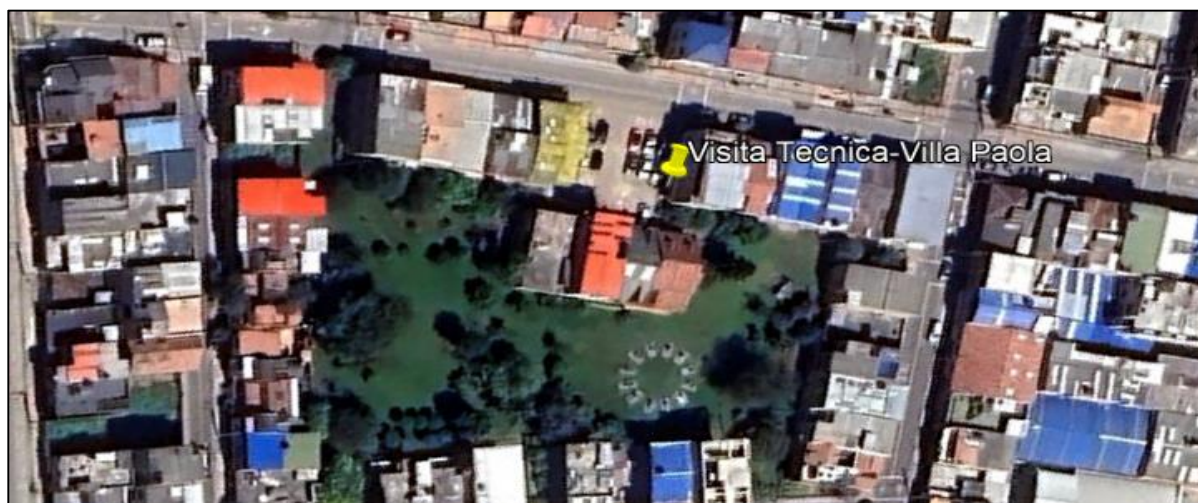
Ilustración 1. Ubicación visita técnica – Barrio Villa Paola

Teniendo en cuenta que ante el municipio de Funza se interpuso queja por afectación (tala-poda) de árboles en espacio público, el día 27 de septiembre personal adscrito a la Secretaría de Ambiente y Bienestar Animal realizó inspección, de conformidad con el acta de visita ambiental No. 172, en el barrio Villa Paola (ver ilustración 1), coordenadas 4°43'32.168" N y 74°13'4.617" W, como se muestra en la ilustración 2: